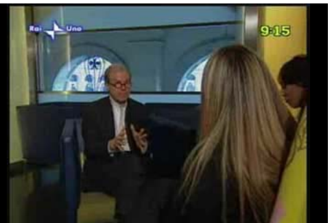
Interpretazione di Nicholas Negroponte TG1 del 15 Gennaio 2010

Fra i vari clienti per cui ho prestato servizi d'interpretazione vi sono: l'OCSE, la Maison Fendi, Hermès, Festival del Cinema di Roma, Festival del Mediterraneo, Rai 3, La Tre telefonia, Assoporti, Regione Lazio, Vicariato di Roma, Ordine dei Trappisti (1 mese di lavoro continuativo per il loro capitolo ad Assisi), Comune di Civitavecchia, Comune di