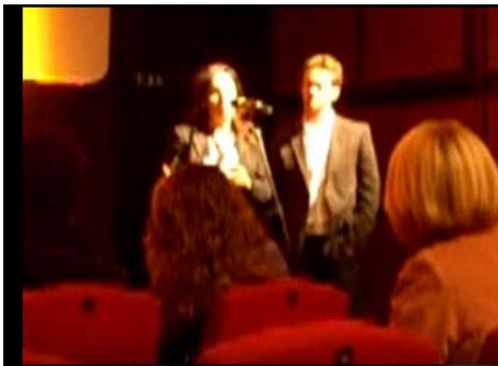
Interpretazione consecutiva al Festival del Cinema di Roma

Roma, la Camera dei Deputati, Il Senato, la regione Lombardia, Astrazeneca, Chiesi Farmaceutica, GlaxoSmithKline, Università La Sapienza, Sua Maestà Rania di Giordania, il Premio Nobel Amartya Sen e molti altri.