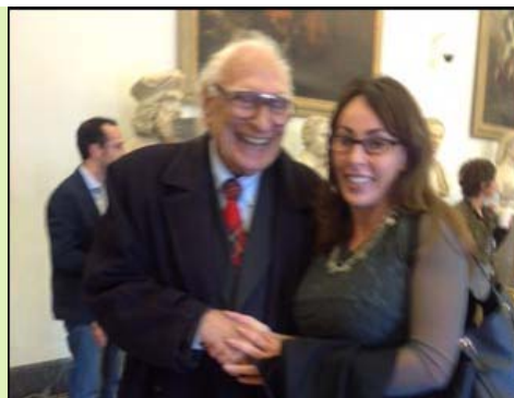
Con il Senatore Marco Pannella al 3° congresso int. per la ricerca scientifica 4-6 Aprile 2014, Campidoglio Roma

ROMA-MILANO-MALTA Cell. +39 347.180.49.37 derosainterpretariato@gmail.com www.interprete-traduttrice.it