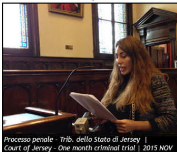
Processo penale - Trib. dello Stato di Jersey | Court of Jersey - One month criminal trial | 2015 NOV