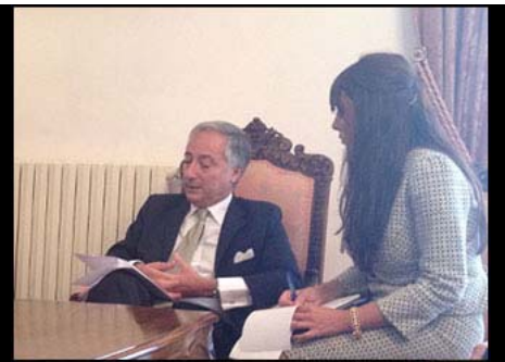
Interpretazione Consecutiva Ministro Patroni Griffi Centro MENA-OCSE Caserta Settembre 2012