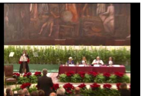
Queen Rania receives Honorary Doctorate, Rome Organizzazione del servizio di traduzione. 2015 DIC