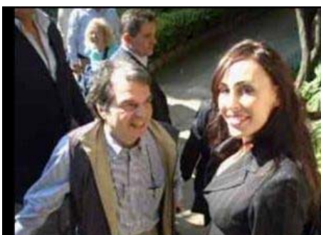
Interpretazione simultanea Ministro Funzione Pubblica Ravello-LAB - 2008

Nella maggioranza degli incarichi svolgo il ruolo di chef d'équipe e mi occupo di contattare i colleghi e relazionarmi con il cliente per gli aspetti organizzativi quali noleggio cabine e reperimento della documentazione relativa al convegno.