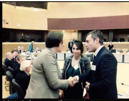
Interpretazione consecutiva presso la Commissione Europea