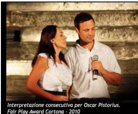
Interpretazione consecutiva per Oscar Pistorius. Fair Play Award Cortona - 2010