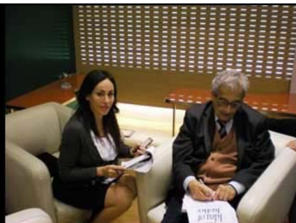
Interpretazione consecutiva di Amartya Sen RAI 3 presso il Forum PA del 19 Maggio 2010