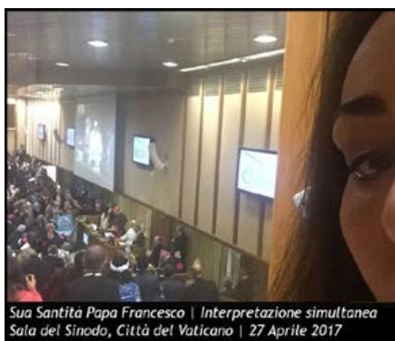
Sua Santità Papa Francesco | Interpretazione simultanea Sala del Sinodo, Città del Vaticano | 27 Aprile 2017