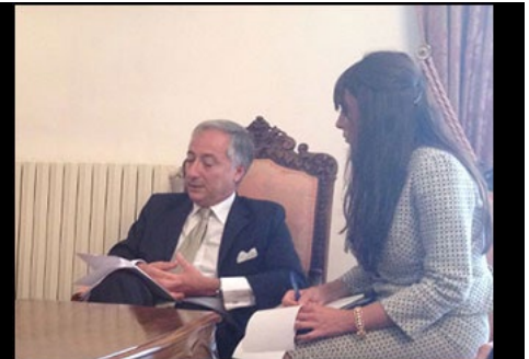
Interpretazione Consecutiva Ministro Patroni Griffi Centro MENA-OCSE Caserta Settembre 2012