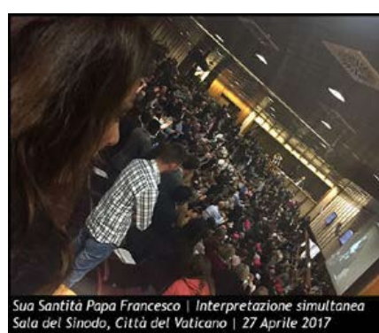
Sua Santità Papa Francesco | Interpretazione simultanea Sala del Sinodo, Città del Vaticano | 27 Aprile 2017