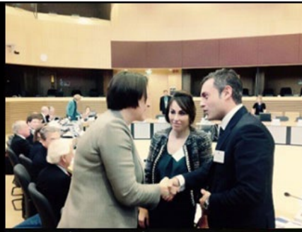
Interpretazione consecutiva presso la Commissione Europea