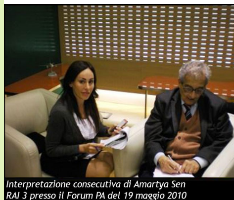
Interpretazione consecutiva di Amartya Sen RAI 3 presso il Forum PA del 19 maggio 2010

ROMA-MILANO-MALTA Cell. +39 347.180.49.37 derosainterpretariato@gmail.com www.interpretraduttrice.it