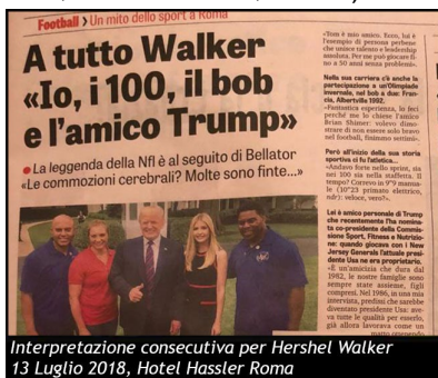
Interpretazione consecutiva per Hershel Walker 13 Luglio 2018, Hotel Hassler Roma