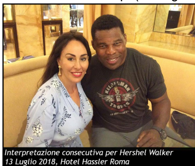
Interpretazione consecutiva per Hershel Walker 13 Luglio 2018, Hotel Hassler Roma