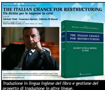
Traduzione in lingua inglese del libro e gestione del progetto di traduzione in altre lingue.