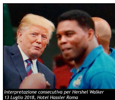
Interpretazione consecutiva per Hershel Walker 13 Luglio 2018, Hotel Hassler Roma