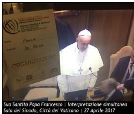
Sua Santità Papa Francesco | Interpretazione simultanea Sala del Sinodo, Città del Vaticano | 27 Aprile 2017