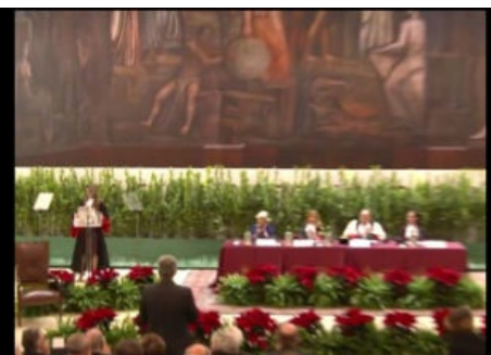
Queen Rania receives Honorary Doctorate, Rome Organizzazione del servizio di traduzione. 2015 DIC