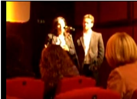
Interpretazione consecutiva al Festival del Cinema di Roma

Fra i vari clienti per cui ho prestato servizi d'interpretazione vi sono: l'OCSE, la Maison Fendi, Hermès, Festival del Cinema di Roma, Festival del Mediterraneo, Rai 3, La Tre telefonia, Assoporti, Regione Lazio, Vicariato di Roma, Ordine dei Trappisti (1 mese di lavoro continuativo per il loro capitolo ad Assisi), Comune di Civitavecchia, Comune di Roma, la Camera dei Deputati, Il Senato, la regione Lombardia, Astrazeneca, Chiesi Farmaceutica, GlaxoSmithKline, Università La Sapienza, Sua Maestà Rania di Giordania, il Premio Nobel Amartya Sen e molti altri.